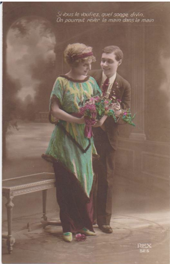
Éditeur : Société Anonyme des Papeteries de Levallois-Clichy, photo : inconnu, Paris, c. 1925

Hermann et Von Stephan n'ont sans doute jamais pensé que leur invention aurait un succès aussi fulgurant. Après qu'on eût défini partout dans le monde les dimensions et l'aspect de la carte postale à la fin de 1903 et qu'on en eût libéralisé l'impression et la vente, débute l'âge d'or de la carte postale. On situe cet âge d'or entre 1904 et 1918 environ. De multiples compagnies éditrices de cartes postales voient le jour. Des milliards de cartes postales sont alors mises en circulation partout sur la planète. À Saint-Jérôme, la librairie Prévost en affichait pour la vente dans la vitrine de son commerce de la rue Julie (rue Parent, là où se trouve actuellement la Caisse Desjardins).