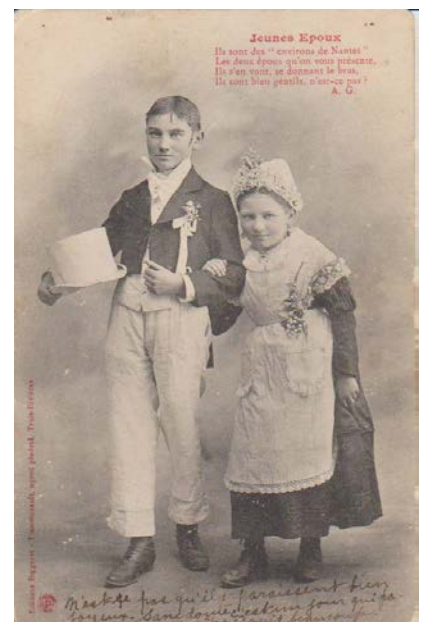
Éditeur : Bergeret, Pinsonneault, agent général, Trois-Rivières, c. 1904

Sur la carte postale ci-contre, le prétendant qui voulait exprimer clairement le but de sa cour pouvait toujours envoyer à l'heureuse élue une image de ce couple de Nantes qui avait enfin franchi l'étape du mariage ! Une image vaut mille mots, fussent-ils des mots d'amour !